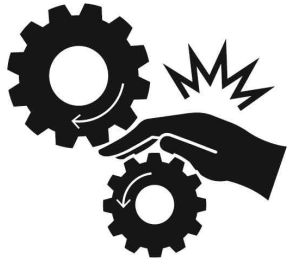
끼임 주의 Beware of getting caught