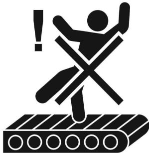
컨베이어어 통행금지 No passage on conveyors