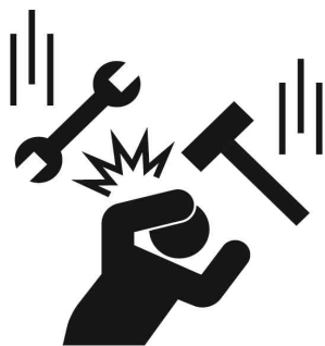
물체 맞음 주의 Beware of being hit by objects