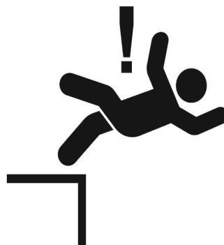
떨어짐 주의 Beware of falling