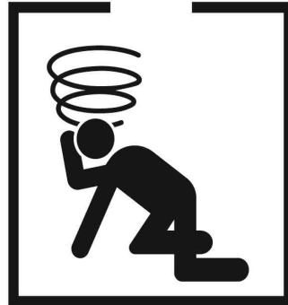
밀폐공간 출입금지 No entry to confined spaces